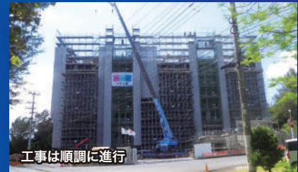
工事は順調に進行

5月末段階の状況としては、6月30日棟上げを目指し8階では躯体工事が、6階ではコンクリートブロック積み、4階は床設備の配管を実施中と、各階とも工事は順調に進行しています。開業が待ち遠しい瀬嵩のホテルに国内外から注目が集まっています。