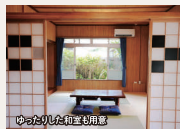
ゆったりした和室も用意

宿泊料金は1泊1グループ(7人まで)で税別30,000円(ただし宿泊時期により変動あり)。豊か