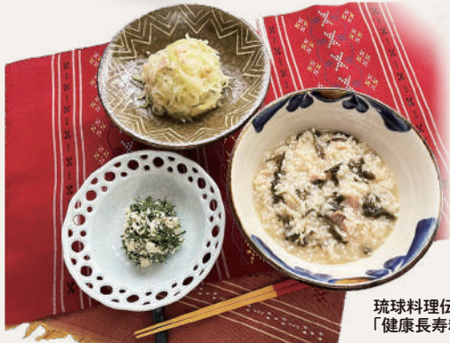
琉球料理传承人と創る 「健康長寿料理」

住所: 〒905-0404 沖縄県国頭郡今帰仁村上運天463 電話: 050-1517-9094 休日: 年中無休 営業時間: チェックイン15:00～ チェックアウト～11:00