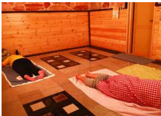
鋪滿墊子的室內，最多可以容納16人。

2011年3月11日發生的大地震為日本的東北地區帶來相當大的打擊。其中福島縣的核能發電廠，加上爐心溶解這樣的事故，損害非常的嚴重，要復原的道路更加的困難。但是人們非常的努力地跨越這些困難，邁向復興的道路。