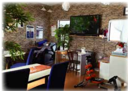
休閒室也準備得非常充足

If you know of any unique use for electrolyzed water, we'd love to hear from you! 電解水的獨特使用方法在徵募中!