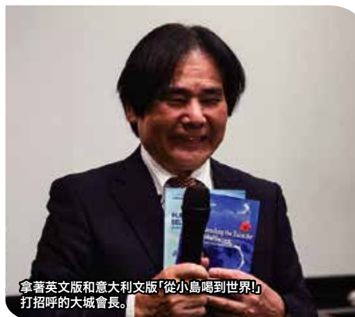
拿著英文版和意大利文版「從小島喝到世界!」打招呼的大城會長。

為了慶祝去年轉移至新辦公室，意大利分店舉行了盛大的「剪綵儀式」並十分榮幸大城會長夫婦得以一同參與。同時，升級者認定儀式也一併進行，參加者們都非常的開心。