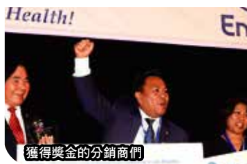
獲得獎金的分銷商們