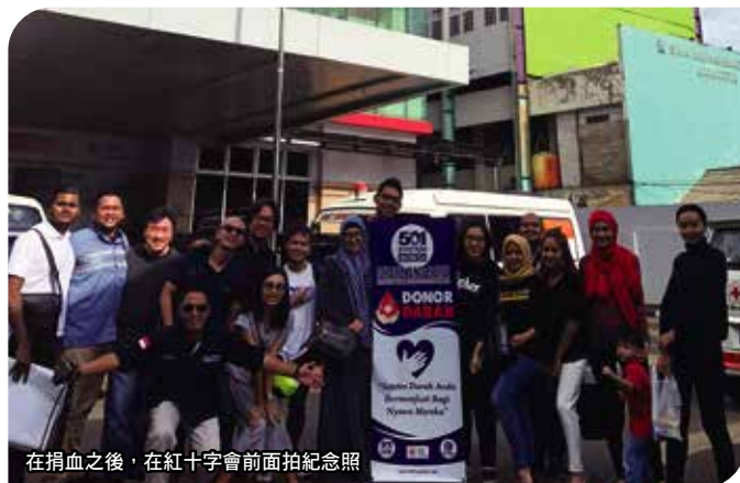
在捐血之後，在紅十字會前面拍紀念照

另外在峇厘島以幫助窮困者生活的其中一環，免費提供還原水和食物，大家都很开心。就如推廣「仁愛的圈子」的實踐，久可先生表示，「今後也會積極地舉辦像這樣的活動。」