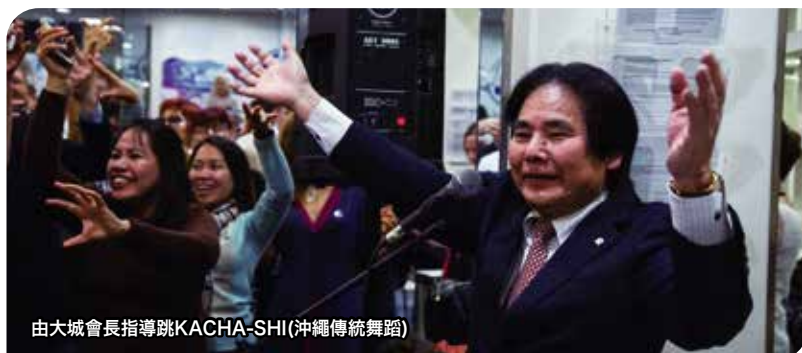
由大城會長指導跳KACHA-SHI(沖繩傳統舞蹈)