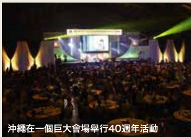
沖繩在一個巨大會場舉行40週年活動

全球經銷商的祝福話語如紙片般飛來。究竟有哪個企業在沖繩辦過這種國際大會呢？筆者是