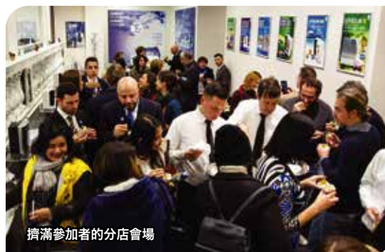
擠滿參加者的分店會場