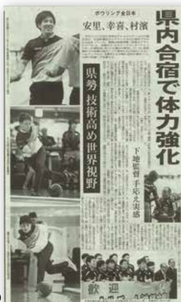
合宿的情況被盛大報導的「琉球報紙」(1月11日發行)