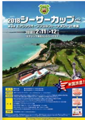
報導風獅杯舉行的「沖繩Times」

2月11~12日Enagic瀨嵩鄉村俱樂部舉辦第11屆「2018風獅杯」。這是分為國高中男子、國高中女子跟小學男女三個部門的青少年大賽，在這之後奔向世界的道路，在等待著他們。