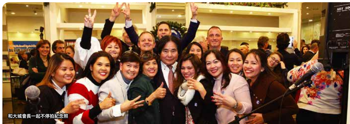
和大城會長一起不停拍紀念照