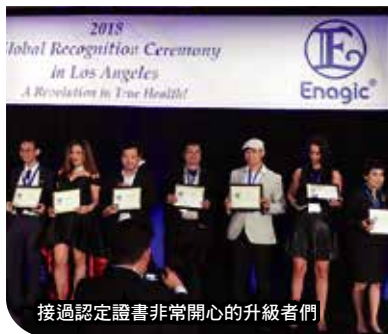
接過認定證書非常開心的升級者們