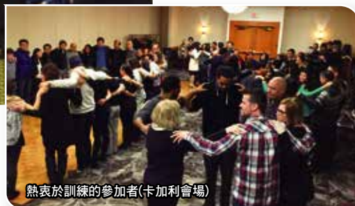
熱衷於訓練的參加者(卡加利會場)