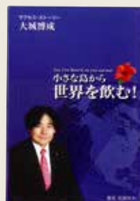
【前原利夫・著 『小さな島から世界を飲む！』より】

當時有一段軼事：使節團幾乎全員著洋服，僅岩倉梳武士頭、穿和服渡洋。後來被同行的兒子說服，在芝加哥落了髮，之後便著洋服上路了。為該使節團翻譯的是新島讓。他開設英語學校，之後創辦了基督教主義的同志社大學。使節團中清一色是對日本文明開化貢獻良多的知名人物，如伊藤博文、大久保利通等。他們在美國停留了8個月後，橫渡大西洋遠赴歐洲。