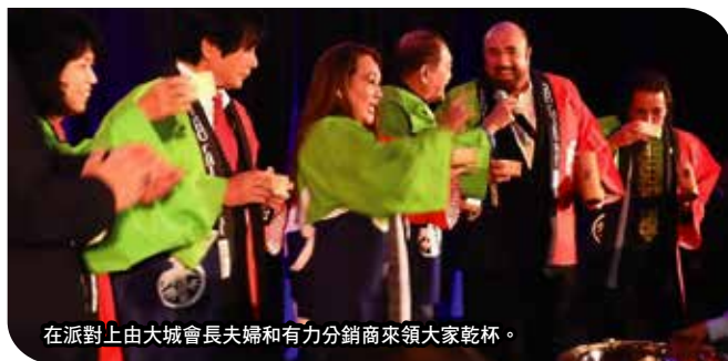
在派對上由大城會長夫婦和有力分銷商來領大家乾杯。

接下來，由有力分銷商帶來的事業訓練，各個講師根據自己的風格，不吝於分享為了擴展「仁愛的圈子」的管理及知識。在雞尾酒派對跟「E8PA」會員的會議之後，下午6點開始這次的重頭戲，(新6A以上)升級者認定&獎金頒發儀式。由各國來參加的升級者們，都滿面笑容地在台上接受認定證書或獎金。