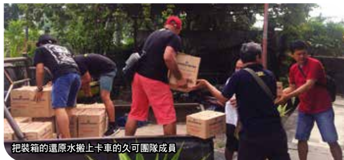
把裝箱的還原水搬上卡車的久可團隊成員