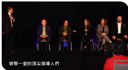
齊聚一堂的頂尖領導人們